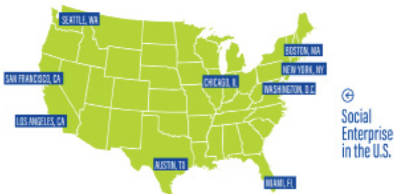
Рисунок 1. Города, наиболее благоприятные для социального предпринимательства

На карте можно видеть, что распределены города очень неравномерно и расположены по периметру страны, за исключением Чикаго 3 .