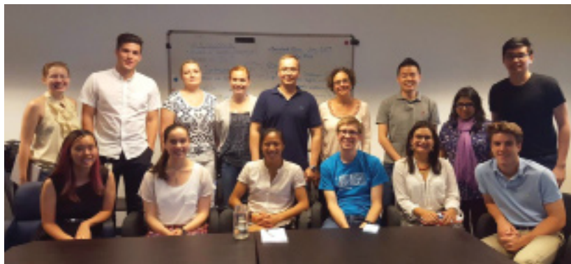
Рисунок 3. На встрече в Фонде Ashoka.

При таком подходе бизнес не так важен, это просто инструмент. Его используют, чтобы люди четко понимали цель и имели конкретный план ее достижения. Во время отбора стипендиатов, устраивается жесткий стресс-тест. Кандидату задают массу самых каверзных вопросов, как он будет решать те или иные возможные проблемы. Написать бизнес-план может каждый, куда важнее уметь справляться с неожиданными ситуациями и преодолевать кризисы. Возможно, поэтому 90% организаций, поддержанных Ashoka, до сих пор в деле, даже спустя 10 лет и более.