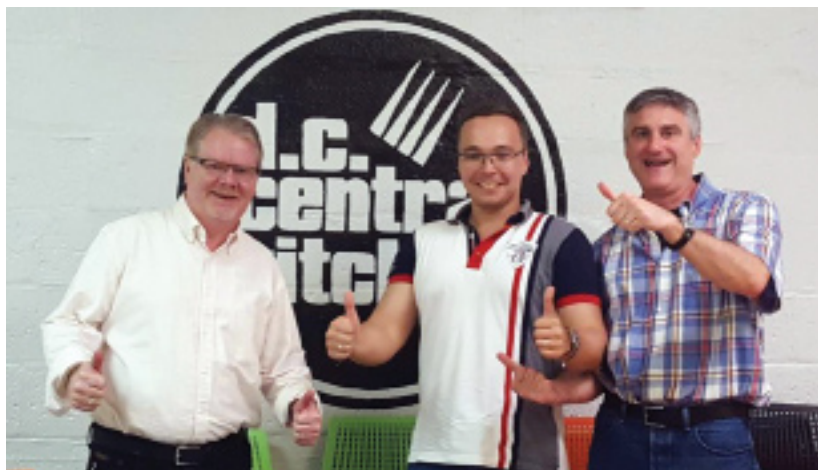
Рисунок 6. На встрече в DC Central Kitchen.

Основная составляющая деятельности DC Central Kitchen – приготовление еды для американских школ. Эти деньги идут от федерального Правительства, Министерства сельского хозяйства, которое платит за школьное питание. Но это абсолютно коммерческие деньги, они платят только за приготовление